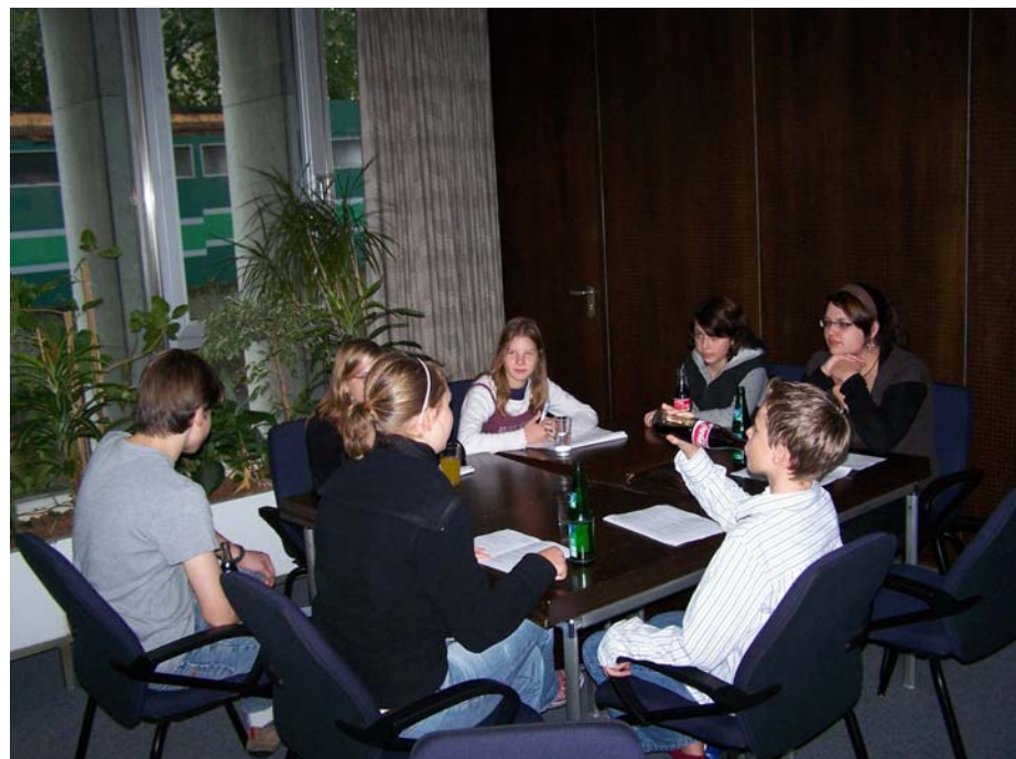
Es wurde über Möglichkeiten diskutiert, die Vernetzung zwischen den Schulen zu verbessern.