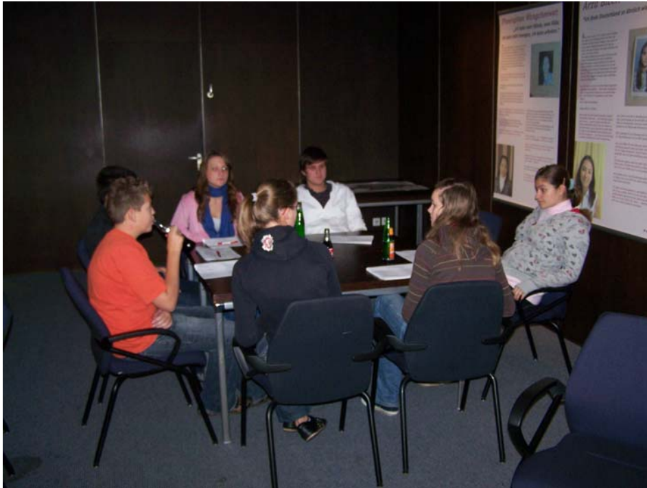
Die Klassen- und Schulsprecher der Schulen und Mitglieder des Kinder- und Jugendbeirates aus Elmshorn diskutieren in Gruppen über Kommunikationsprobleme an den einzelnen Schulen.